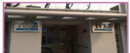
COLEGIALES AV. ELCANO 3555 C.A.B.A. ver mapa