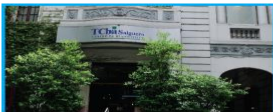
ALMAGRO J. SALGUERO 560 C.A.B.A. ver mapa

Médicos Residentes: Becas Anuales de Formación.