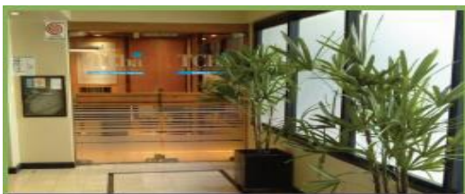
MICROCENTRO SUIPACHA 570 4ºA C.A.B.A. ver mapa

Postulantes extranjeros: Por la resolución vigente del Ministerio de Educación, Universidad de Buenos Aires y Ministerio de Salud es requisito para poder rendir examen de Residencias e ingresar a la Carrera de Especialista en Diagnóstico por Imágenes contar con título médico revalidado convalidado y matrícula profesional .