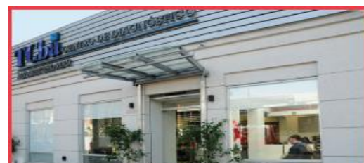
URQUIZA AV. ALVAREZ THOMAS 2681 C.A.B.A. ver mapa